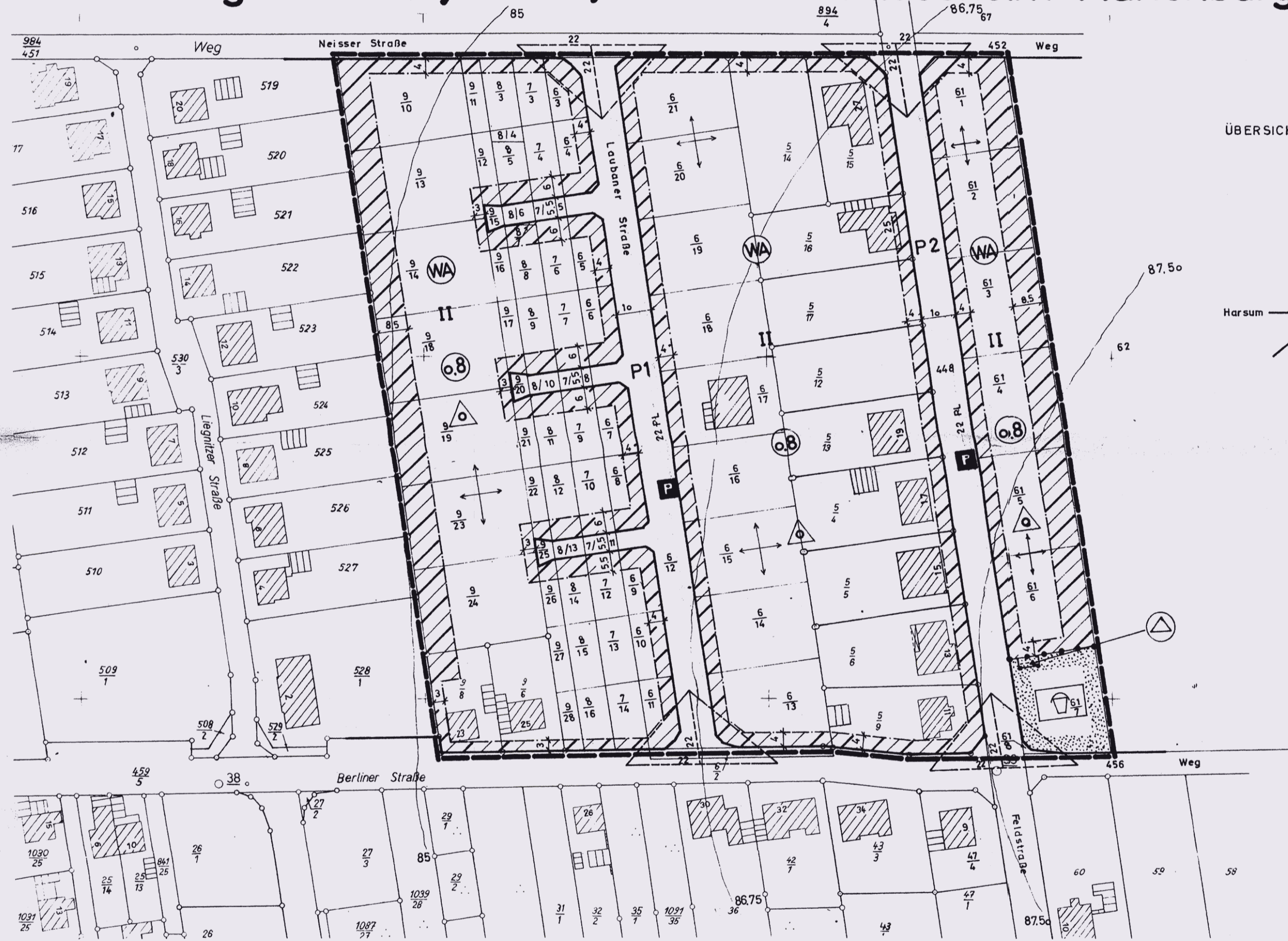
ÜBERSICHT M. 1:25000